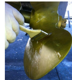
Aplicación de la capa transparente