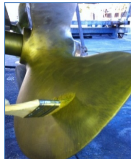
Aplicación segunda capa de imprimación