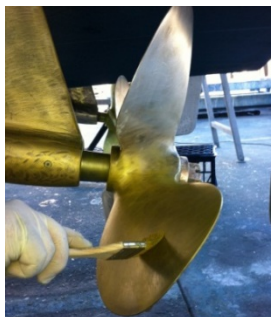
Aplicación primera capa de imprimación