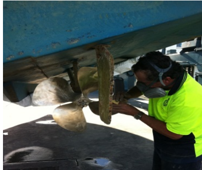
Préparation avec une meuleuse et brosse métallique