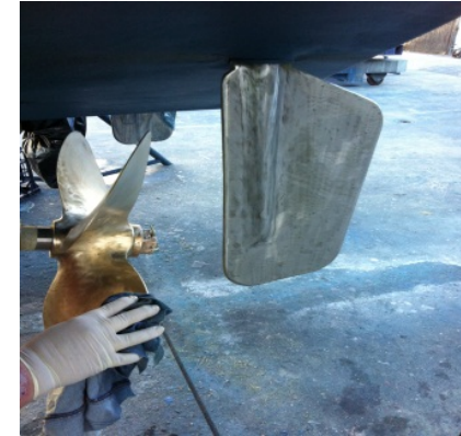
Application de Prop Wash