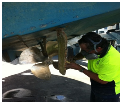
Preparazione della superficie con la smerigliatrice