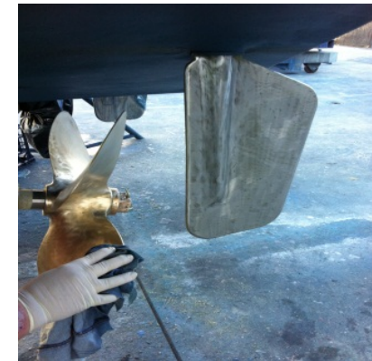
Pulizia con Solvente con un panno