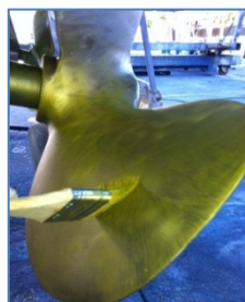
Seconda mano di primer